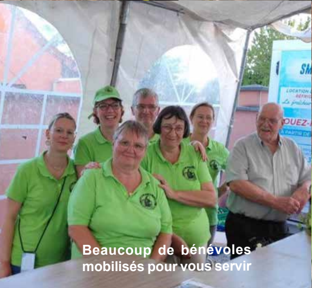
Beaucoup de bénévoles mobilisés pour vous servir