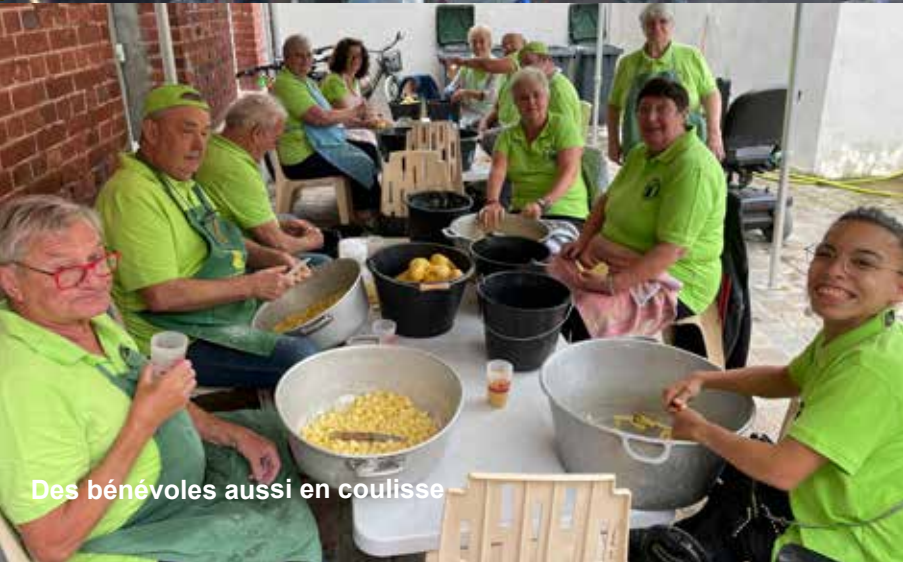
Des bénévoles aussi en coulisse

Merci à tous d'avoir contribué à ce beau succès !