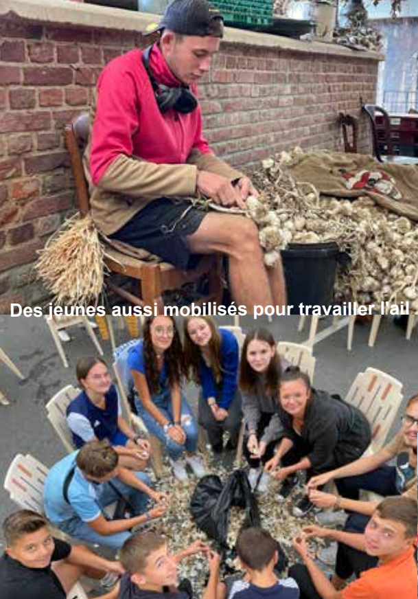
Des jeunes aussi mobilisés pour travailler l'ail