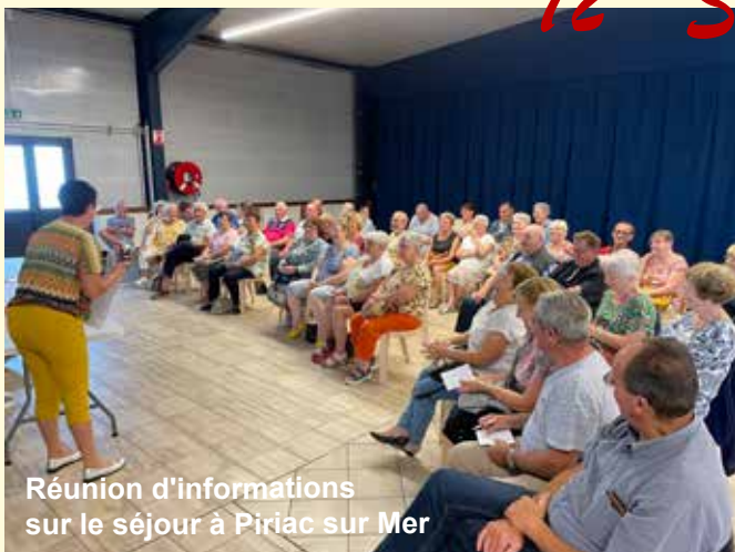
Réunion d'informations sur le séjour à Piriac sur Mer