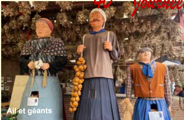
Ail et géants