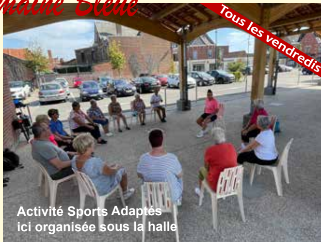
Activité Sports Adaptés ici organisée sous la halle