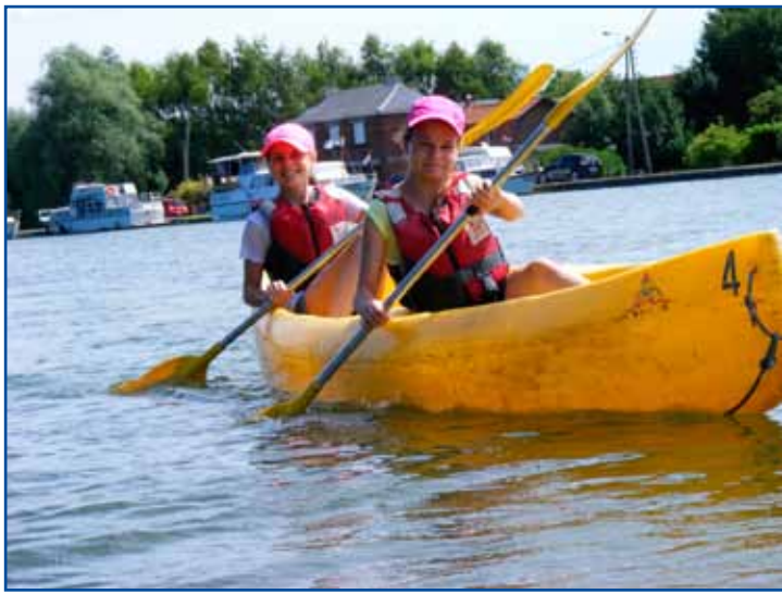
Sur le plan d'eau du bassin rond.