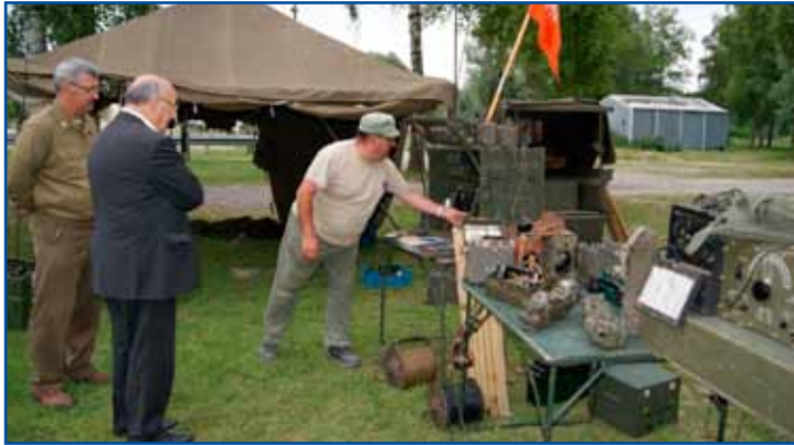
Rendez-vous de passionnés de matériels militaires U.S, au terrain de moto-cross.