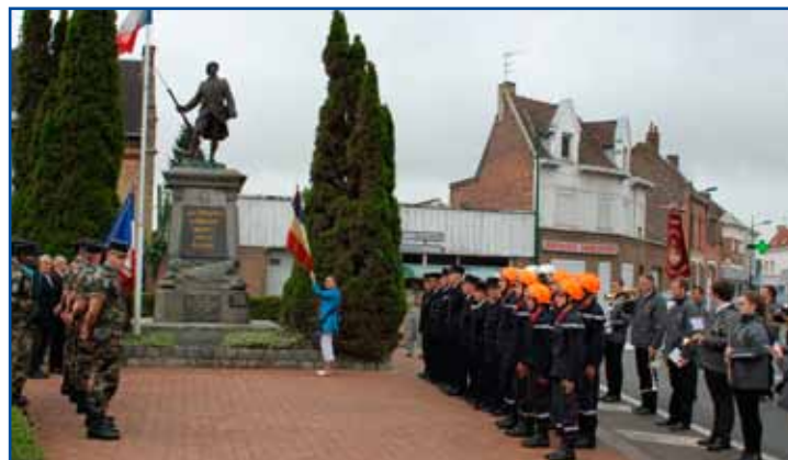
La cérémonie officielle.

Enfin, après la remise des lots du concours de pavoisement des bateaux et que le verre de l'amitié fut pris, c'est dans une ambiance «guinguette au bord de l'eau» que l'après-midi s'est terminée dans la joie et la bonne humeur.