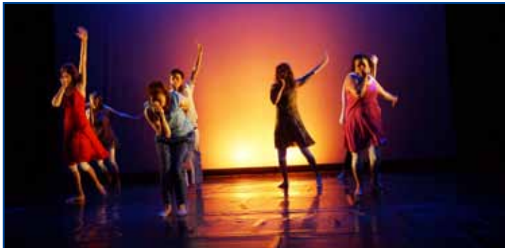
Spectacle de Salomé-Danse, les 3 et 4 juillet, au théâtre de Douai.