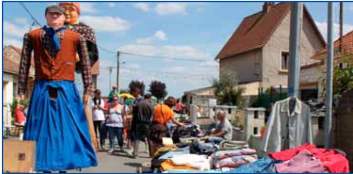
Brocante du comité de «Cambrésis en Fête».