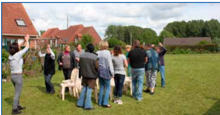
Fête de quartier, résidence les Biselles.