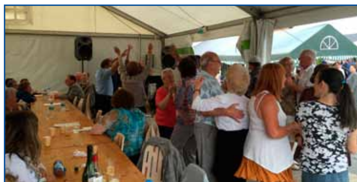
Au rendez-vous des bateliers.