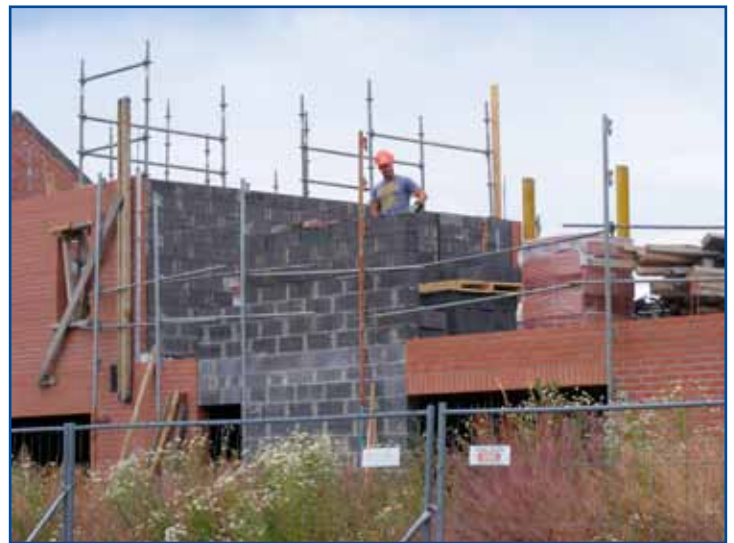
Les 27 logements locatifs «Basse consommation» sont sortis de terre.