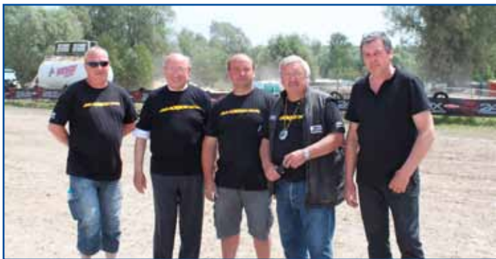
Compétition de moto-cross, les élus ont rencontré les organisateurs.