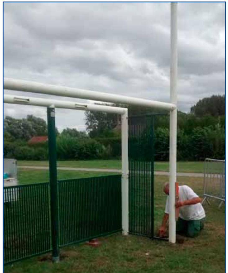
Aménagement, parc du lotissement des biselles (expérimentation).