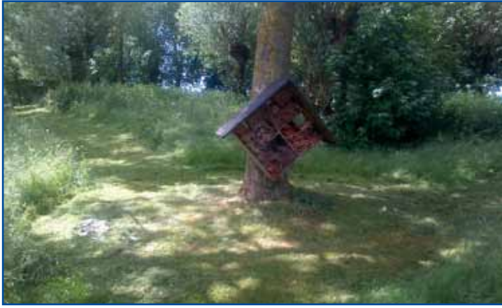
Entretien des espaces naturels.