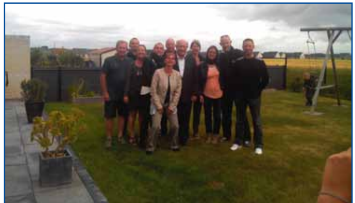
Fête de quartier, résidence les berges du canal.