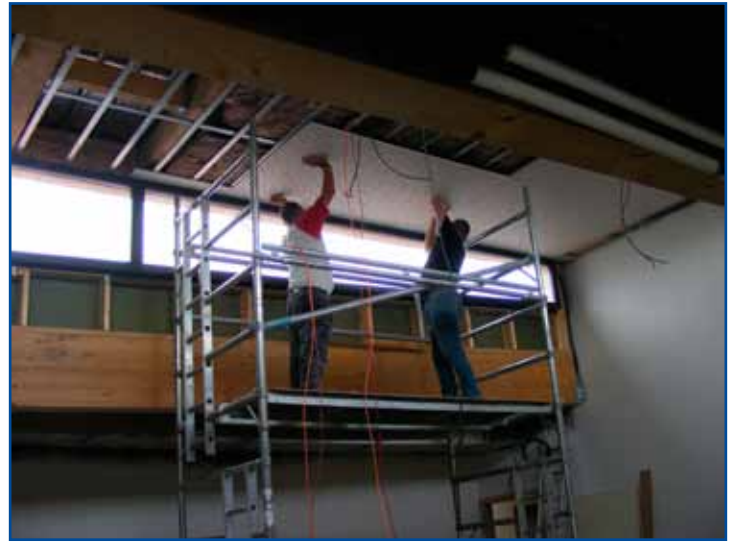
Les travaux du nouvel EHPAD avancent rapidement.