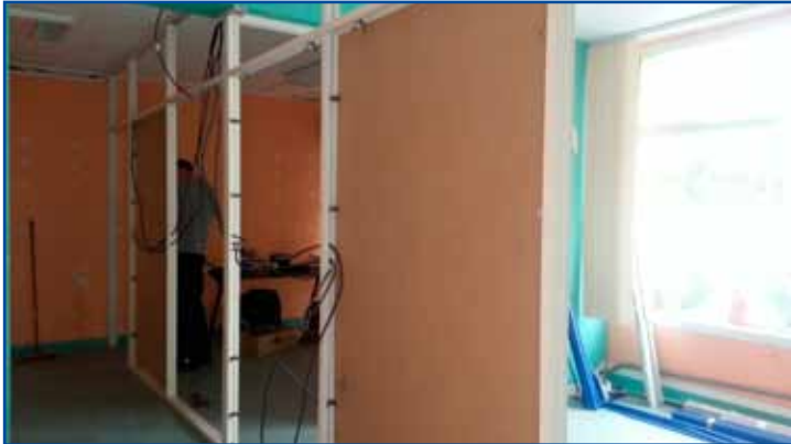
Les nouveaux locaux de la PMI (Protection Maternelle Infantile) seront prêts cet automne.