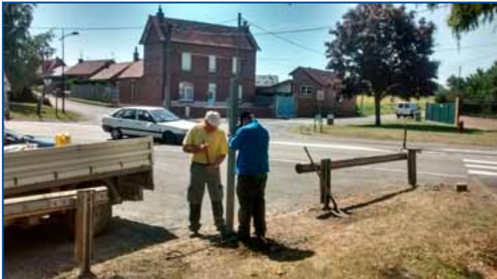
Limitation du stationnement pour mieux protéger les espaces verts.