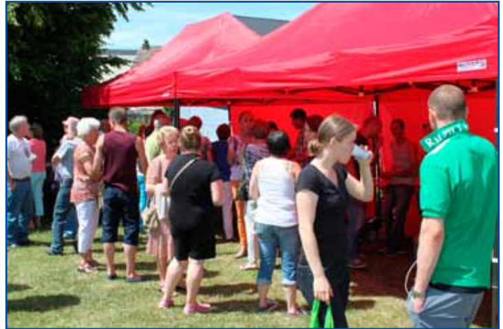
Fête de quartier, cité du cambrésis.