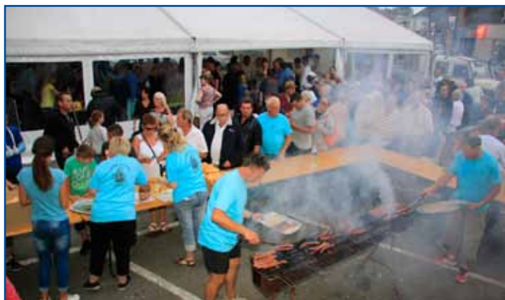
Après l'effort, le réconfort d'un barbecue géant.