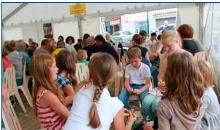
C'est l'occasion de rencontres intergénérationnelles.