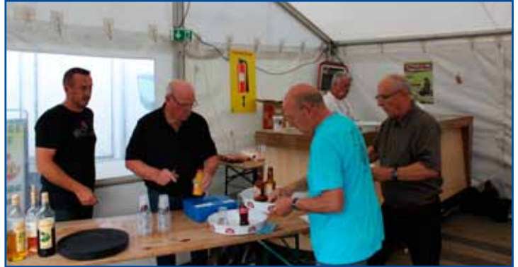
Buvette de la rue Fily.