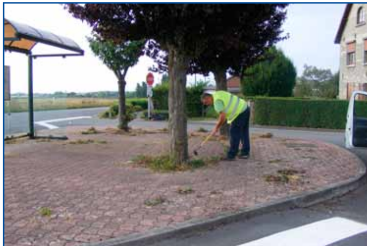
Entretien des espaces, cité du cambrésis.