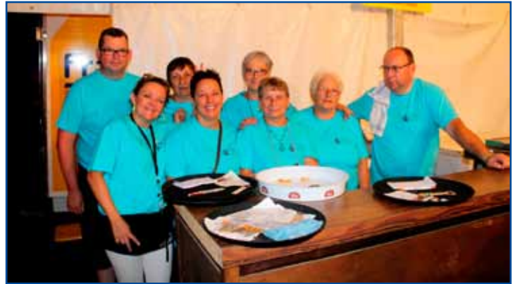
Une partie à la buvette du centre.