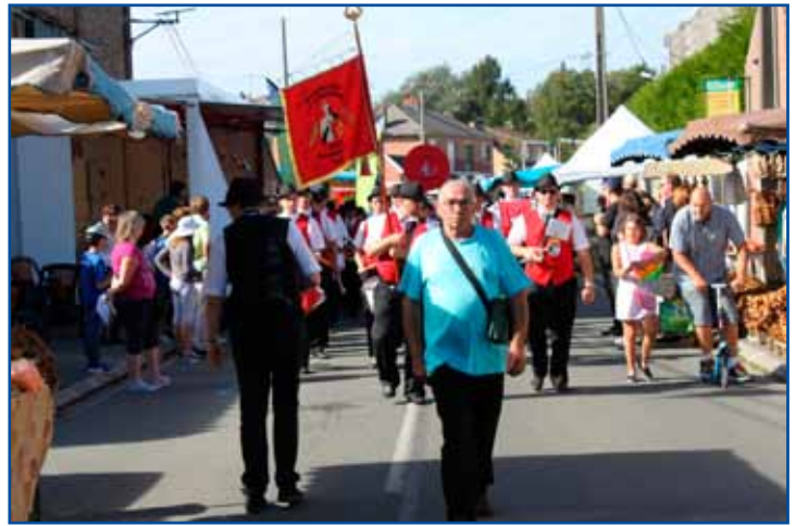
Beaucoup d'animations sur le champ de foire pour cette 55 ème édition.