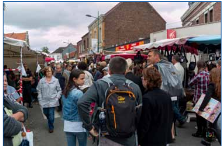
Les visiteurs n'ont pas boudé notre foire, malgré un contexte particulier.