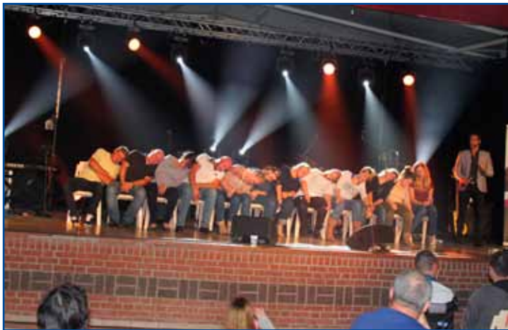
Spectacle d'hypnose surprenant !