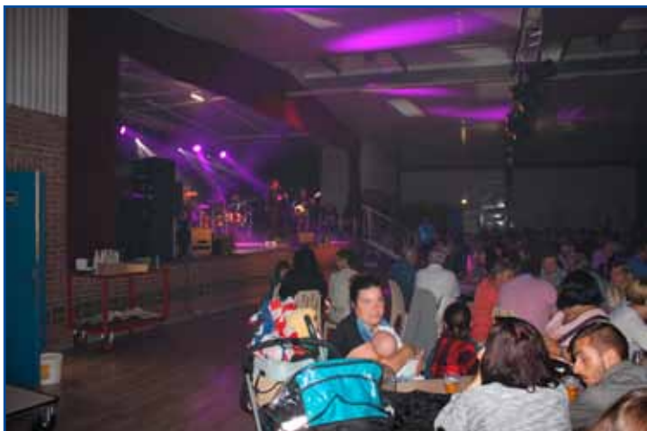
Spectacle musical du lundi, à la salle des fêtes.