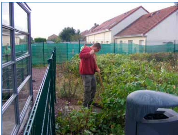
Entretien de l'espace gare.