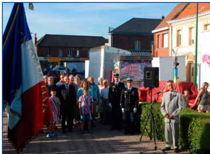
Commémoration de la libération d'Arleux, ce 1 er septembre.