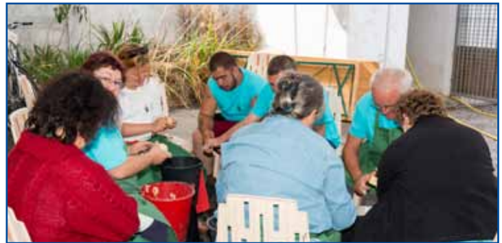
Une tonne de pommes de terre !