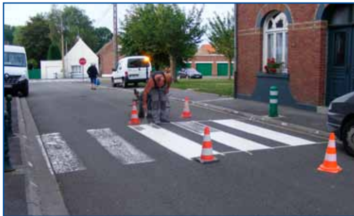
Signalisation au sol.