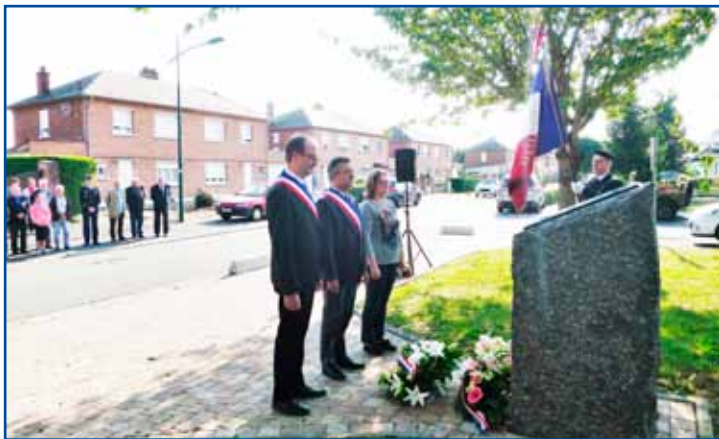
Journée Nationale d'hommage aux Harkis, 25 septembre.