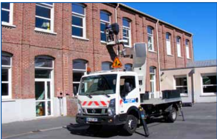
Nettoyage extérieur des vitres, aux écoles.