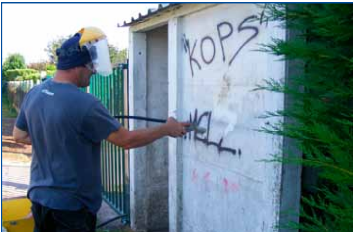
Nettoyage des tags par une société spécialisée.