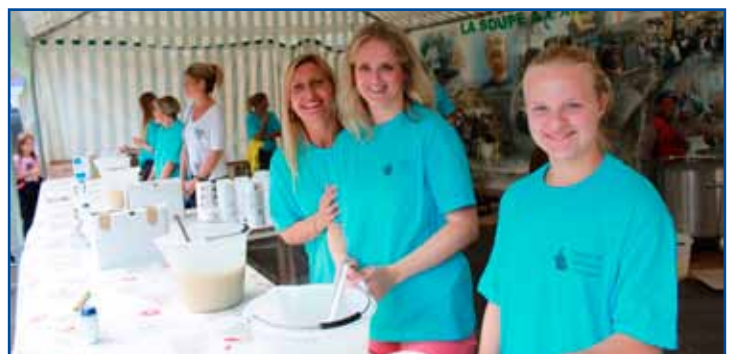
Du service de soupe.