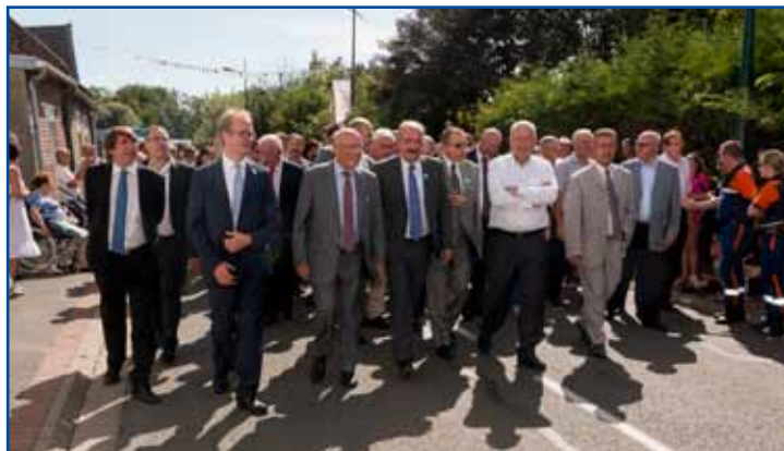
Beaucoup d'élus (Député, Président du Conseil Départemental, conseillers régionaux, conseillers départementaux, Président du Syndicat des transports et de nombreux maires), M. le Sous-Préfet et des personnalités civiles et militaires ont assisté à l'inauguration, marquant ainsi leur attachement à nos fêtes rurales.