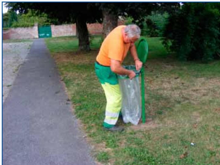
Pose de poubelle translucide, quartier de l'enclos.