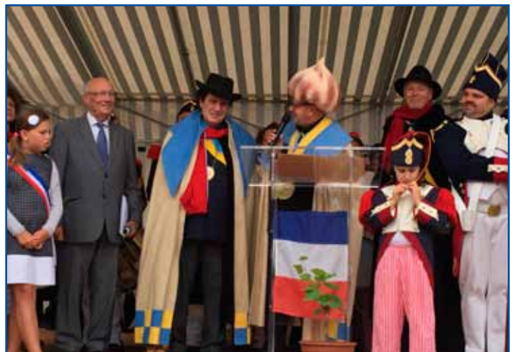
La «République de Montmartre» est venue signer un jumelage avec la confrérie de l'ail fumé et notre Commune.