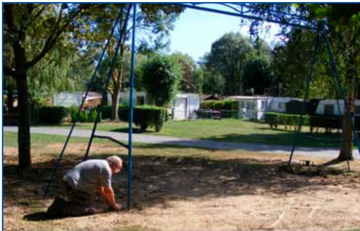
Démontage des jeux, non conformes, au camping municipal.