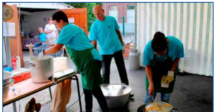
Fabrication de la soupe.