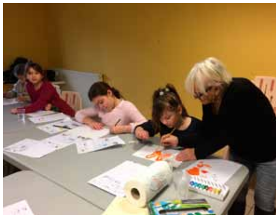
Atelier d'Arts Plastiques