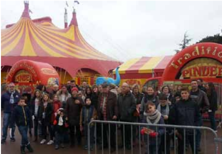
Photo souvenir avant de rentrer dans l'immense chapiteau

Le 9 décembre 2015, le comité de la foire à l'ail fumé avait planifié, pour ses bénévoles et leurs enfants, une sortie à Paris au cirque Pinder. Les effroyables attentats qu'a connus la capitale avaient conduit à l'annulation du déplacement.