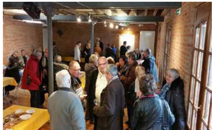
L'association VMEA tenait aussi son Assemblée Générale au moulin avec dégustation de la galette