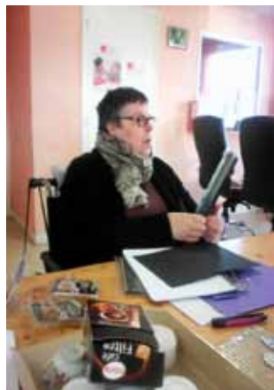
Atelier de scrapbooking