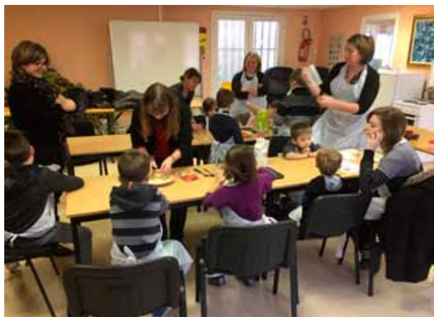
Atelier de cuisine en famille

Les ateliers mis en place ces derniers mois par le Centre Communal d'Action Sociale préfigurent les activités qui intégreront, avec d'autres, la planification du futur Espace de vie Sociale. Leur réussite démontre la capacité de la Commune à fédérer les énergies. Un grand bravo aux animateurs qui s'y investissent, pour la plus part bénévolement.