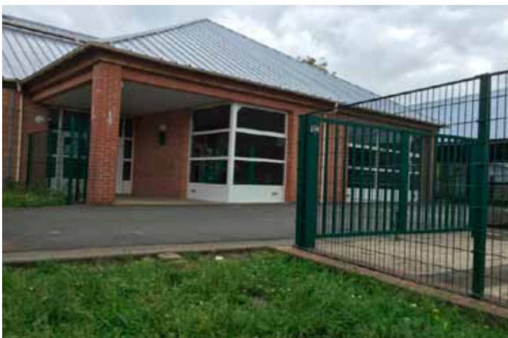
Ecole Bouly Richard, grand rue

- pour l'école François Noël , le mardi jusqu'au 1er mars à 8h30 ou à 13h45 ; en cas d'impossibilité, se faire connaître au plus vite auprès du directeur par téléphone au 03 27 99 60 01.