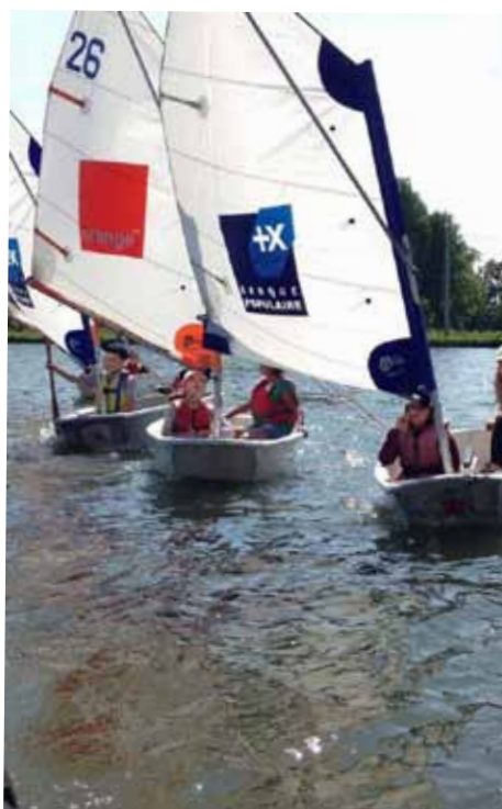
Expérience de la voile à Bouchain