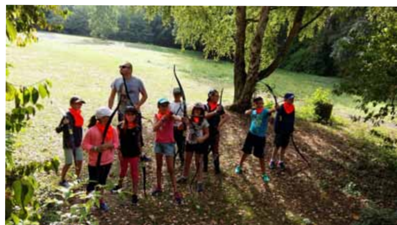
Tir à l'arc à la base de loisirs de Wingles