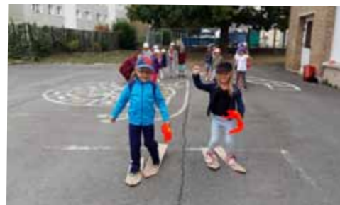
Jeux olympiques dans la cour