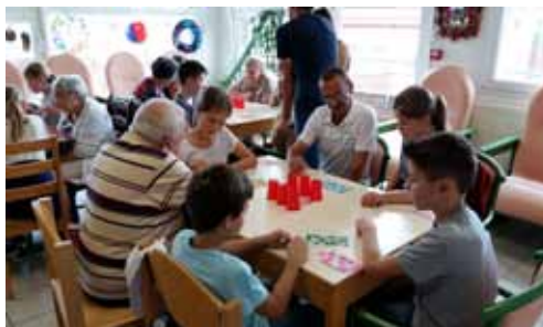
Rencontre ludique avec les résidents du béguinage