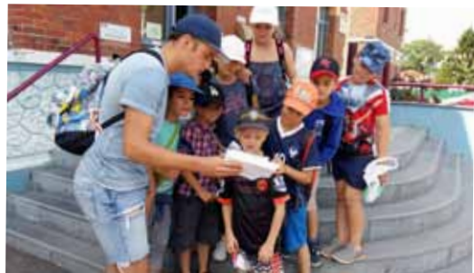
Jeu de piste dans la Commune

Trois semaines en juillet et trois semaines en août, les enfants ont été ravis de leurs activités proposées aux accueils de loisirs. En complément des nombreuses activités manuelles et jeux ludiques sur le thème du sport, les enfants ont eu l'occasion de participer à de multiples sorties : mer de sable, parc départemental d'Olhain, Bagatelle, la base de loisirs de Wingles, sortie plage à Malo les Bains, Loisparc étaient au programme de chaque mercredi. Le béguinage et la société de pêche l'Arleusienne ont contribué aux loisirs des enfants en les accueillant chaleureusement. Enfin, le Département a offert à l'ensemble des participants des initiations au kinball, athlétisme, golf, voile, flag foot et tennis de table. Le camping a été un grand moment de plaisir partagé pour les enfants de plus de neuf ans avec un programme également chargé en activités sportives. Le dernier vendredi de chaque session a été l'occasion d'une rencontre entre les parents et les enfants, avec des épreuves toujours gagnées par les enfants... Prochain centre durant les vacances de la Toussaint.