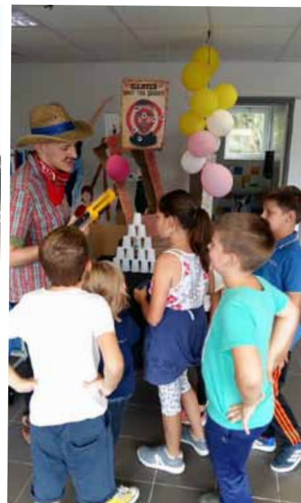
Une reconstitution réussie