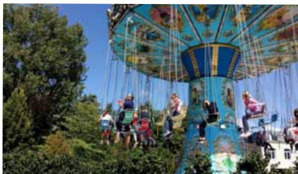
Au parc de Bagatelle, attractions pour petits et grands