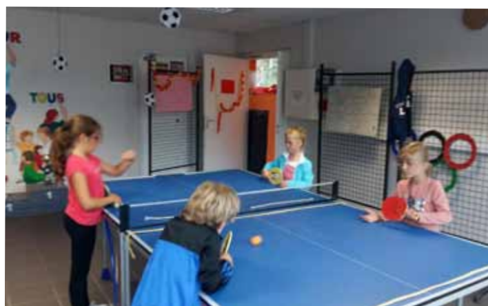
Tennis de table organisé avec le concours du Département