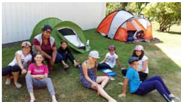
Le plaisir du camping, entre copains et copines