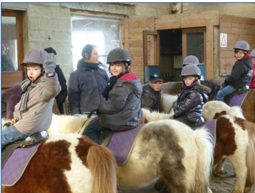
Au centre équestre

Le séjour s'est achevé par une grande cérémonie de remise des insignes. Un grand buffet et un gâteau d'anniversaire à l'intention de