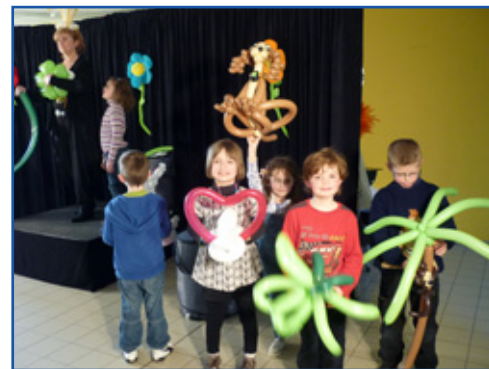
Spectacle de magie