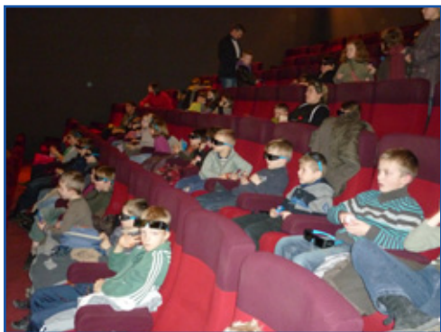
Au cinéma, en 3D