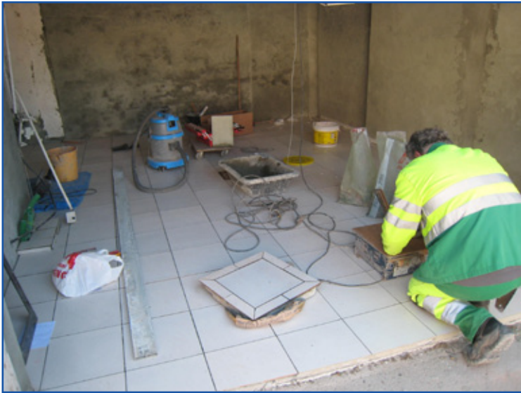
Réhabilitation du local de préparation des légumes, pour la foire.