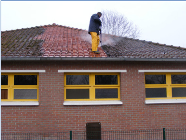
Travaux d'entretien au camping municipal (toitures, élagages, blocs sanitaires).