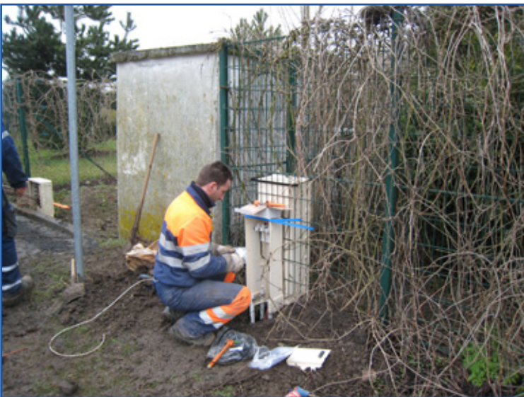
Nouvelle alimentation électrique, au terrain communal de bicross.