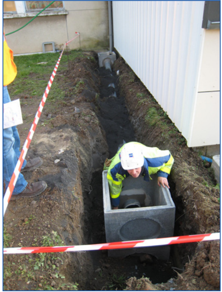
Travaux de voirie et de réseau, extension de l'école F.Noël.