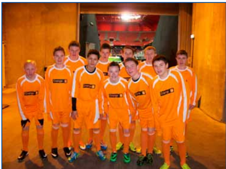
Nos jeunes à leur arrivée au stade du Hainaut, et quelques temps plus tard : prêts pour entrer sur la pelouse.

Nouvel exemple des bienfaits pour les jeunes du Club de ce partenariat signé avec le VAFC : les U15 de l'Olympique Senséen ont été invités à participer au challenge Orange au stade du Hainaut à Valenciennes au cours du match VAFC- Nice du samedi 8 février.