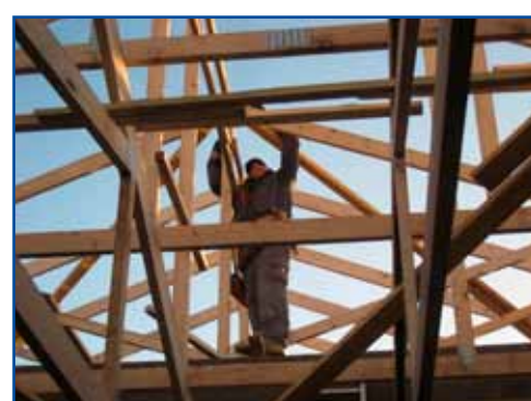
Pose de la charpente et de la couverture, aux futurs locaux de service de la nouvelle Gendarmerie.