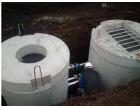
Début du chantier d'assainissement du chemin de la rivière du moulin (pose des réservoirs de pompes).