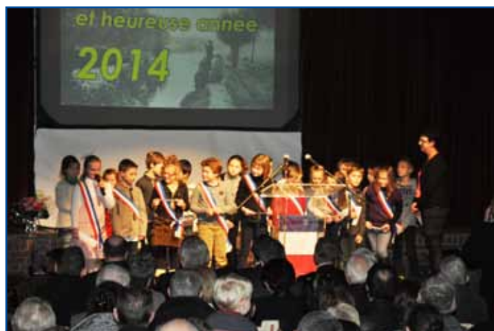
Le Conseil municipal des enfants.