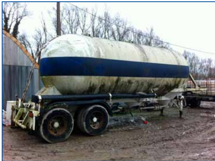
L'association a acquis une citerne pour arroser les pistes et éviter les poussières.