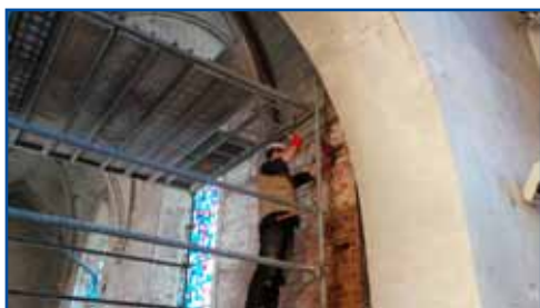
Piquetage des murs au chantier de restauration de l'église.