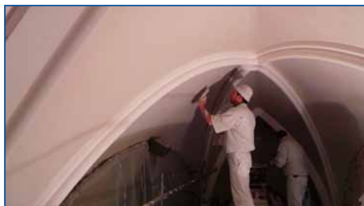
Les travaux intérieurs de l'Eglise avancent désormais à grands pas (Ici le remplacement d'une voûte qui s'était affaissée).