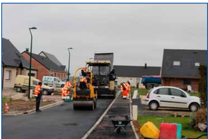
Travaux de finitions au lotissement des jardins d'Isis.