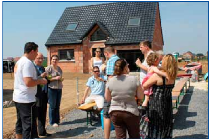
Barbecue, ce 17 mai au lotissement des jardins d'Isis.