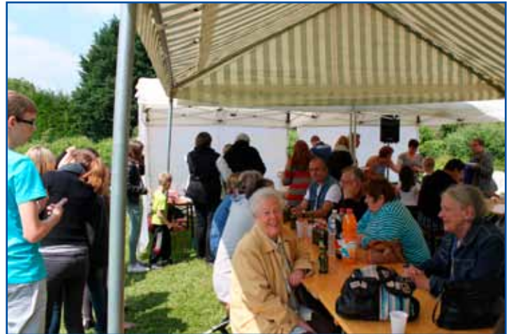
Animations et repas champêtre, ce 31 mai, au quartier des Biselles.

Une dynamique intéressante est donc née, elle profite aux habitants et renforce la cohésion de notre Commune. Décidément, Arleux ne veut pas être une ville dortoir !