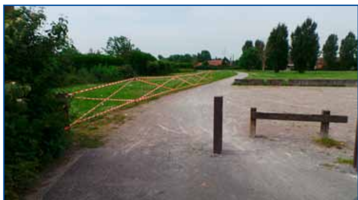
Expérimentation d'un parking supplémentaire au lotissement des Biselles.