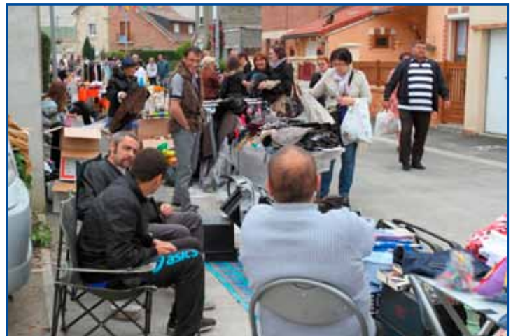
Brocante et animations à la cité du Cambrésis, 1 er juin.