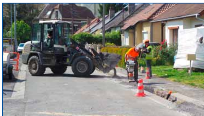
Travaux de remplacement de la canalisation d'adduction d'eau, cité du cambrésis.