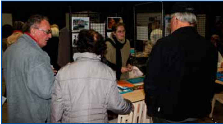
Parmi les nombreuses associations, on comptait «Vivre Mieux Ensemble à Arleux».