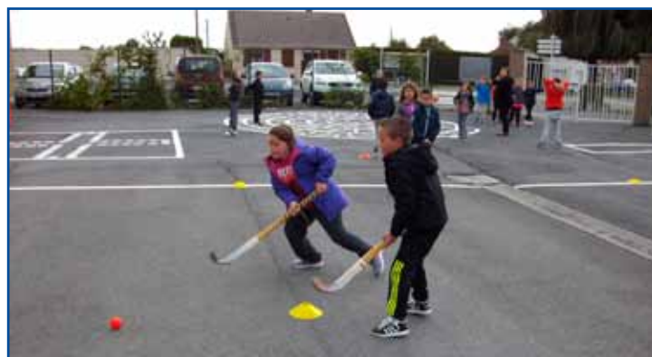
Rencontres sportives, école F.Noël.