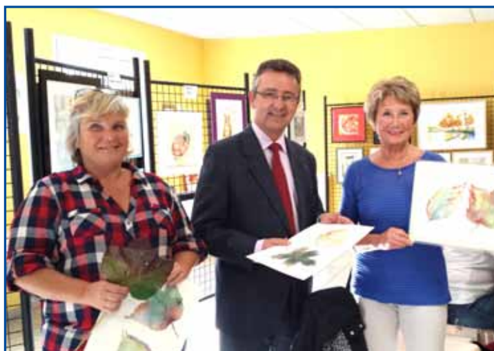
3 octobre, portes ouvertes des ateliers d'artistes à la Maison Pour Tous.