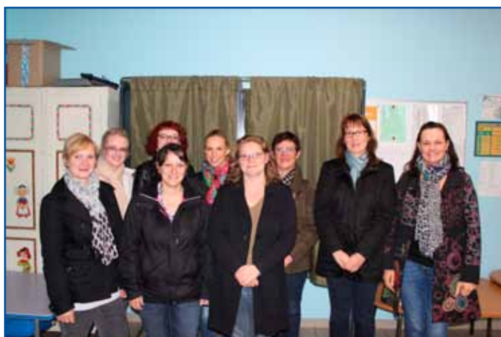
Élection des parents d'élèves au conseil d'école Bouly-Richard.