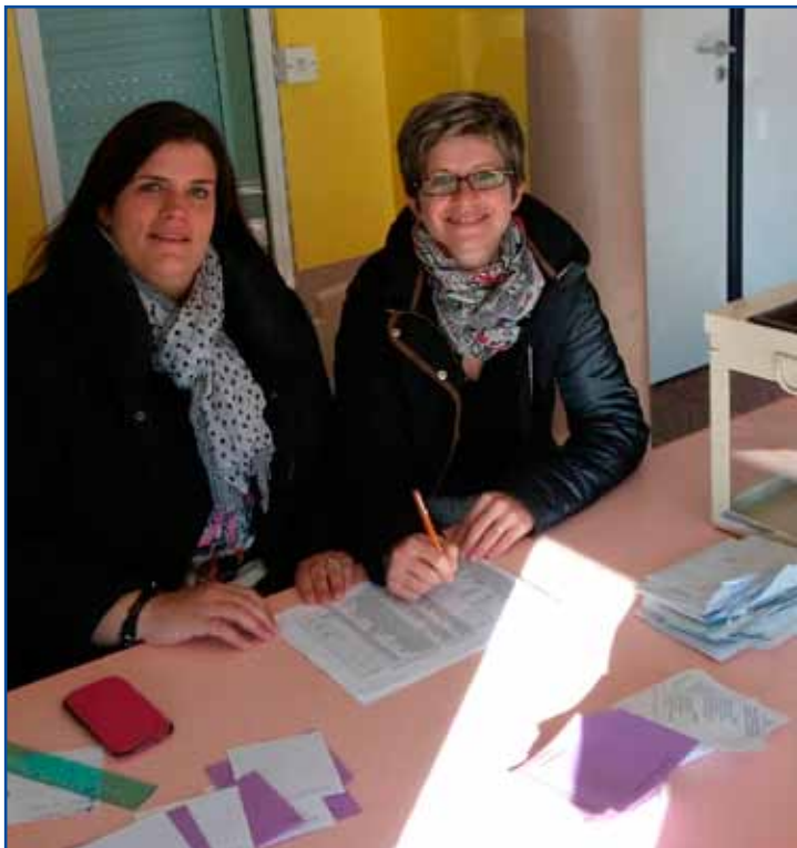
Élection des parents d'élèves au conseil d'école F.Noël.