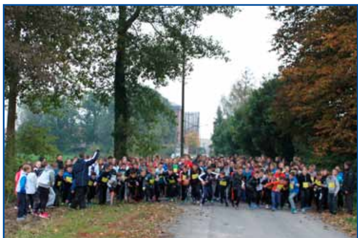
Cross organisé par le Collège Val de la Sensée d'Arleux.