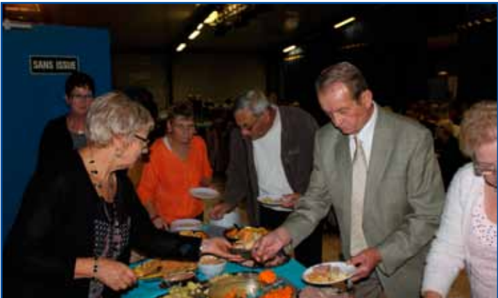
Un repas modeste partagé entre Amis et préparé par l'atelier cuisine du CCAS.