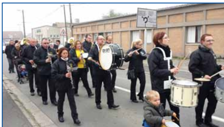
11 octobre, malgré la fraîcheur automnale, le traditionnel défilé de la ducasse du «pont» a déambulé dans le quartier.