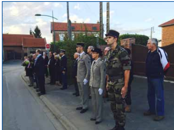
25 septembre, journée nationale d'hommage aux Harkis, stèle de la rue du 8 mai.