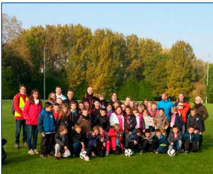
Journée car-foot avec l'école F.Noël et la ligue de foot.