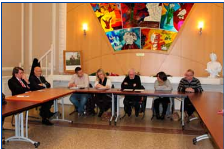
La salle d'honneur de la Mairie avait été mise à disposition pour l'assemblée générale.

L'Assemblée Générale est toujours un moment important de la vie d'une association.