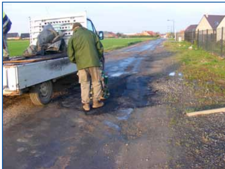
En attendant la subvention du Conseil départemental (votée en mars 2015), les employés communaux ont colmaté les trous de la rue de Brunémont.