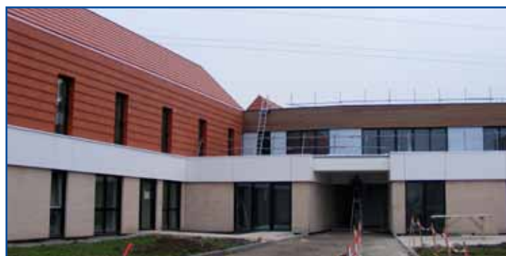
Le nouvel EHPAD sera livré dans quelques mois.