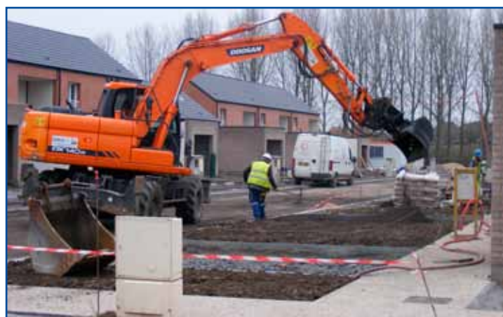
Les voiries qui desserviront les 27 logements sont en cours de réalisation.