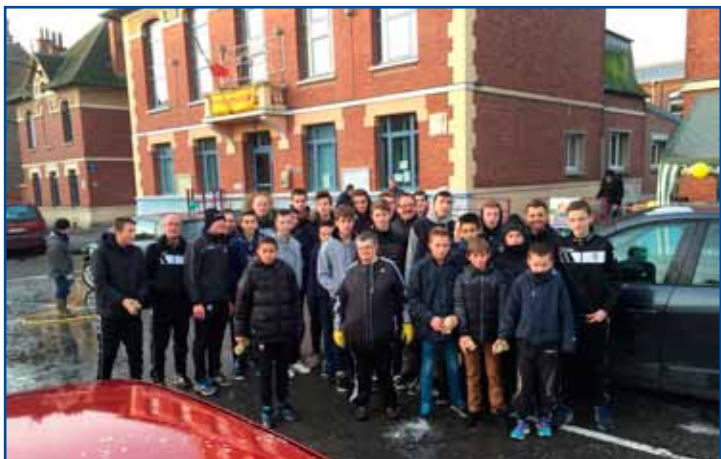
Les jeunes de l'Olympique Senséen se sont mobilisés également en lavant plusieurs dizaines de voitures.