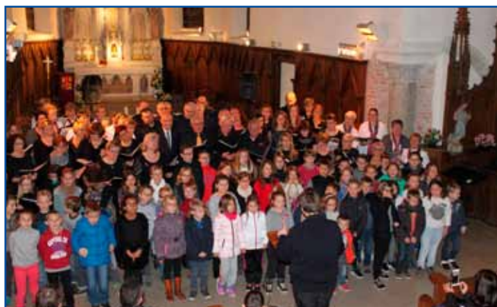
Le concert donné en l'église reste un des moments forts de l'organisation.