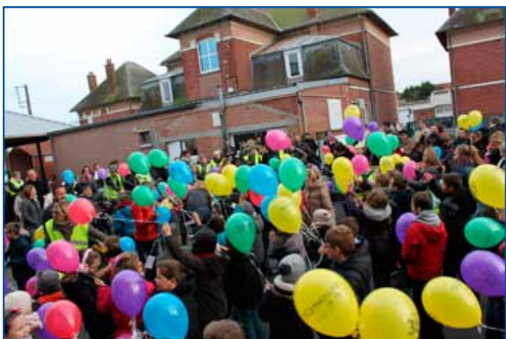
Après le défilé dans les rues d'Arleux, grand lâcher de ballons dans la cour de l'école Bouly-Richard.