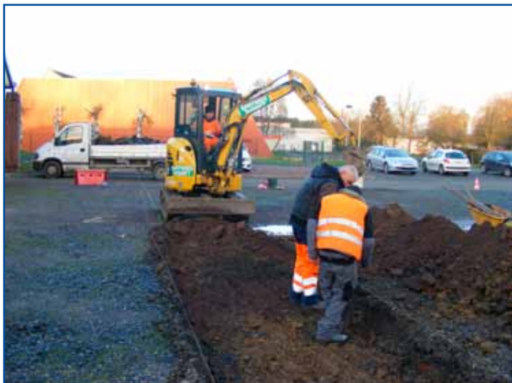
Profitant des travaux sur le parking de la salle des fêtes, un accès roulant est réalisé de telle sorte que les résidents du centre H.Borel voient le cheminement grandement amélioré.