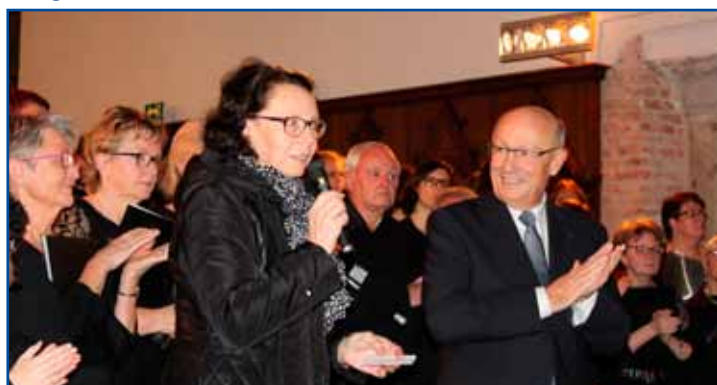
Aux côtés de la Trésorière, M. le Maire a rappelé l'engagement également de l'atelier «Aquarelles en Sensée», de l'office de tourisme au marché de Noël, des actions engagées dans les écoles, des anciens combattants, des pêcheurs, chasseurs, de l'association de quartier Cité en fête, du comité de foire, la boule arleusienne, club des retraités, des dynamix,