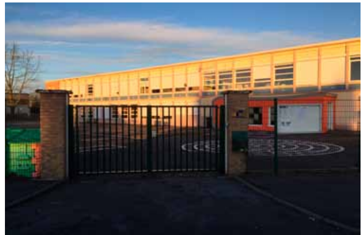
Ecole François Noël, avenue de la gare