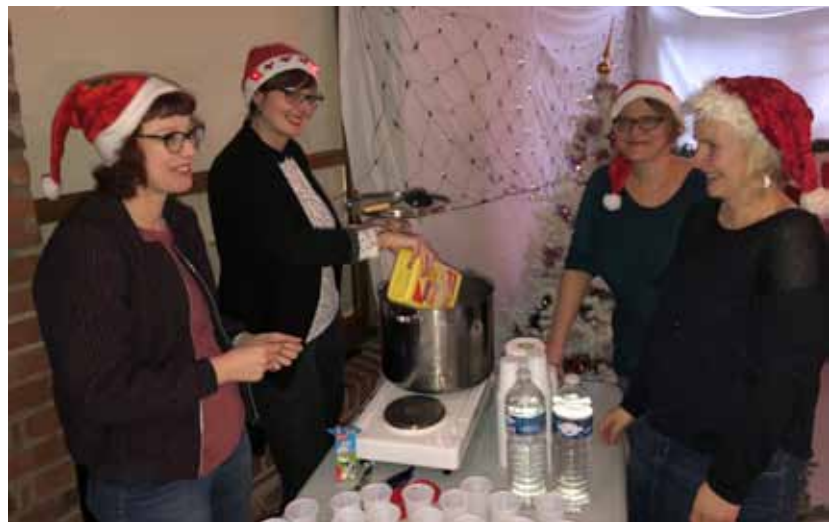
Préparation des fêtes de Noël dans les écoles