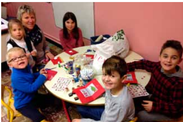
Mobilisation des enfants de la garderie péri scolaire