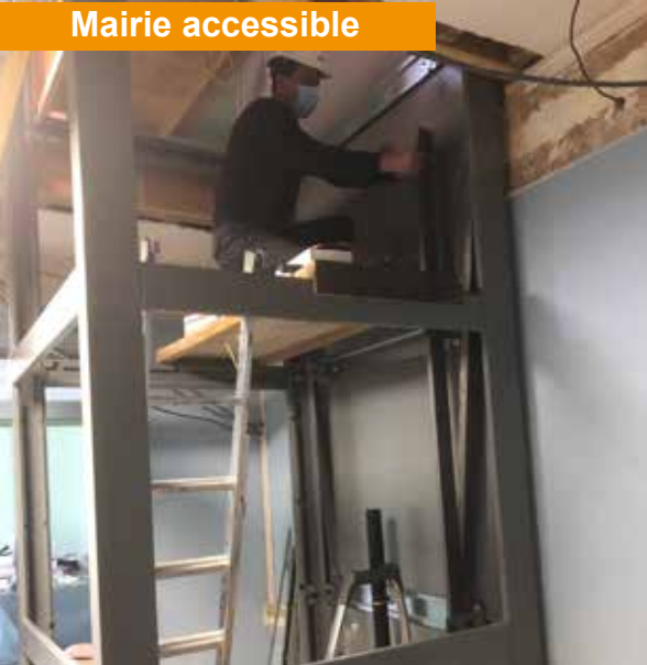
Pose d'un élévateur

Après plusieurs mois de travaux, le chantier de mise en accessibilité de la mairie est terminé. Délocalisés pendant des années au centre culturel, les conseils municipaux mais aussi les mariages, comme cela est souvent demandé, pourront reprendre en mairie. Les normes sont maintenant respectées, les archives sont isolées et le public peut être accueilli en toute sécurité.