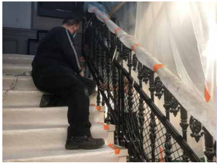
Protection des garde corps, matérialisation visuelle des marches