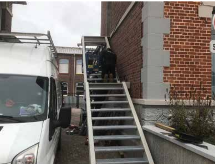
Réalisation des escaliers de secours

De l'extérieur, l'escalier de secours ne passe pas inaperçu, il permettrait l'évacuation du public de la salle d'honneur du premier étage en cas de difficultés. A l'intérieur, l'élévateur permet désormais aux personnes en fauteuil de ne pas être mis en difficulté et de pouvoir participer pleinement à toutes les activités proposées à l'étage. L'escalier a également été revu avec de nouveaux garde corps, une nouvelle main courante et des marches et contre marches visuellement renforcées. L'opération s'est également accompagnée d'un chamboulement des bureaux pour permettre d'être en mesure d'accueillir dans les semaines à venir une Maison France Service. Dès la fin du confinement, l'activité en mairie ne manquera pas de se renforcer.