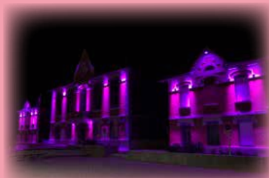
La mairie se parera de rose.

Le dimanche 30 octobre, jour du marché, différents stands de sensibilisation seront organisés le matin en lien avec nos traditionnels partenaires. Une marche sera organisée dans le centre de la commune au départ de la mairie à 10 heures (durée : 45 min).