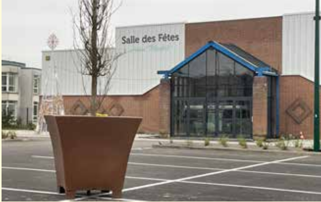
Changement des ouvertures de la salle des fêtes, éclairage solaire et plantations sur le parking