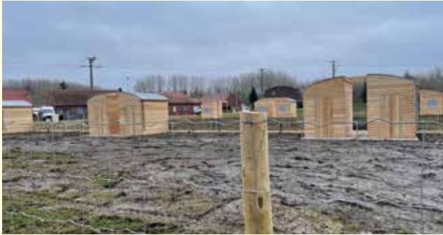
Pose de chalets rue du bias avec un air de ressemblance avec les péniches voisines