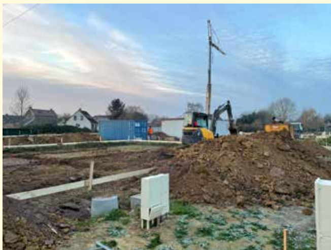
Du côté de l'ancien ehpad, cela bouge enfin; les travaux de gros oeuvre sont enfin engagés.