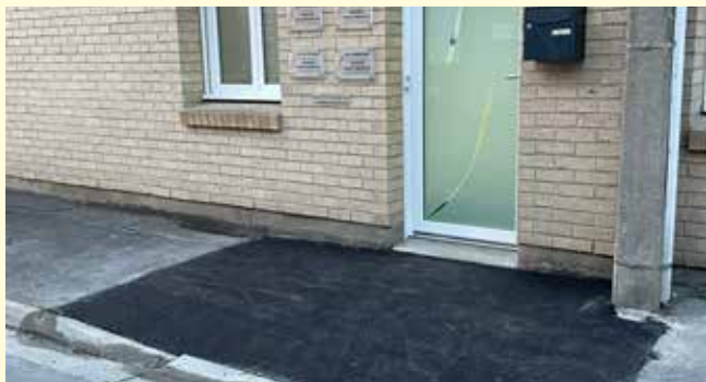
Réalisation d'un adouci devant le cabinet de kiné rue de la poste pour faciliter l'entrée