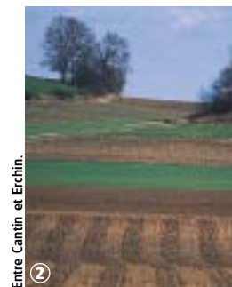
Entre Cantin et Erchin.